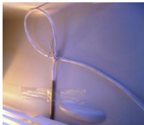
Fig. 3: Bonne pratique-le câble du capteur n'est pas plié derrière la chemise en téflon et la boucle permet relâchement de la contrainte sur la Jonction du câble et du capteur.

Plier le câble directement la gaine en téflon mets à rude épreuve le câble et constitue une mauvaise manipulation qui doit être évitée car elle conduira à des ruptures dans l'isolation, surtout dans les applications à froid (voir la figure 2 ci-dessus).