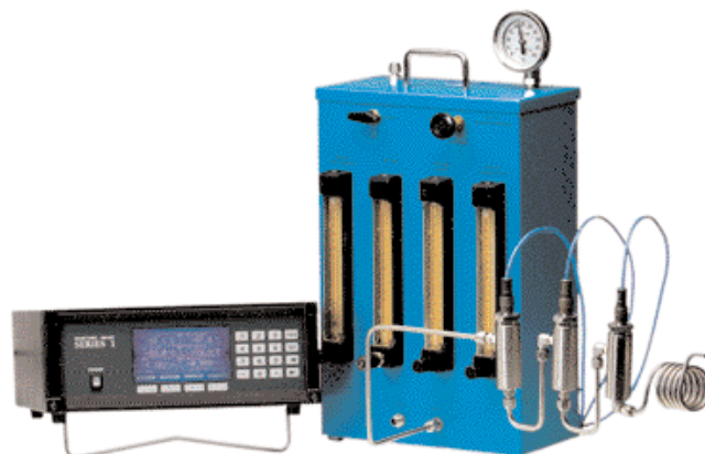
MG101 com analisador da série 1 Moisture Image® para demonstrar calibração do sensor de umidade