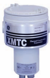
Transmissor de gás de condutividade térmica XMTC