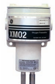
Transmissor de oxigênio termoparamagnético XMO2

O TMO2D é um módulo de controle e visor opcional que aprimora o desempenho e a operação de transmissores, tais como XMO2, XMTC ou O2X1. Ele fornece um visor LCD de duas linhas e 24 caracteres com luz de fundo, visor e opção de programação através do teclado, saídas de gravador, relés de alarme e relés para orientar os solenóides do sistema de amostra na calibração automática de zero e amplitude, bem como uma fonte de alimentação de 24 V CC para o transmissor. O TMO2D também fornece compensação do sinal de oxigênio com base em microprocessador para se obter uma precisão aprimorada para o transmissor TMO2.