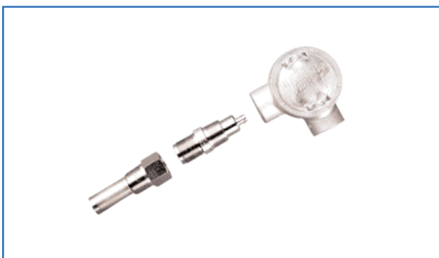
Sistema de buffer FSPA curto

Temperatura do fluido: -40 °C a 315 °C (-40 °F a 600 °F)