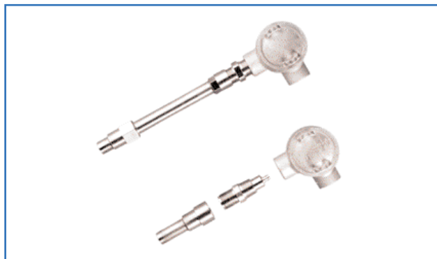
Sistema de buffers FWPA estendido (topo) e sistema de buffers FTWPA curto (base)