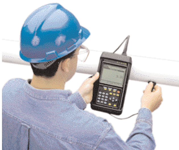
Opção de medição de espessura do PT878

Operação contínua a 37 °C (100 °F); operação intermitente a 260 °C (500 °F) por 10 segundos seguidos por 2 minutos de refrigeração de ar