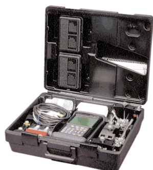
O sistema completo do fluxômetro TransPort PT878 cabe em uma maleta portátil compacta.

Quando você precisa de um registro permanente do seu trabalho, medidas dinâmicas, dados registrados e parâmetros do local, eles podem ser enviados para diversas impressoras por transmissão de dados diretamente da porta de infravermelho do TransPort PT878. Uma impressora térmica com infravermelho portátil, leve e compacta está disponível. Essa impressora é alimentada por uma bateria de íon de lítio.