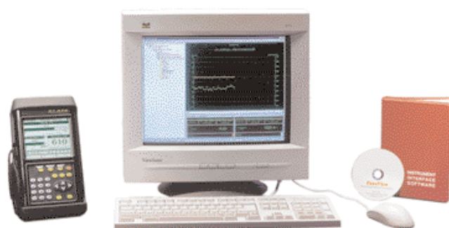
Il software PanaView collega il flussimetro TransPort al PC in dotazione.

L'adattatore ad infrarossi si inserisce in ogni porta seriale disponibile per fornire al desktop del PC funzionalità ad infrarossi.