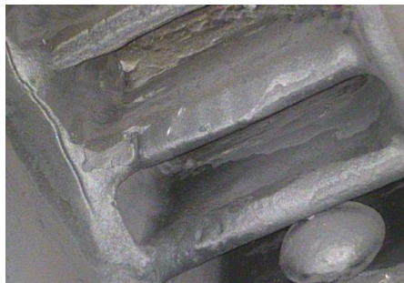
FME do Bloco do Bocal HP