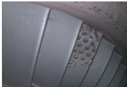
FME na Lâmina da Turbina