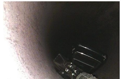
Recuperação da Linha de Extração - Celular