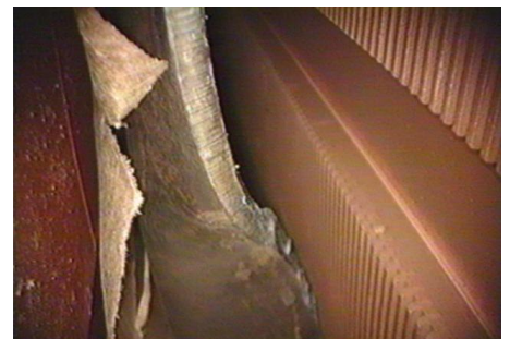
FME do Gerador