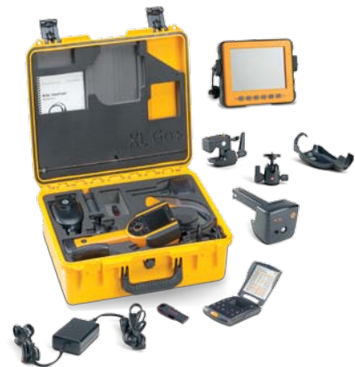
Valigetta di trasporto standard ed accessori per XL Go+