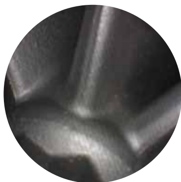
Imagem de turbo impulsor

Estão disponíveis fibras de iluminação de quartzo para aplicações onde é necessária uma fonte de luz UV com o fibroscópio. O quartzo tem eficiência muito maior quando transmite luz UV e fornecerá saída mais intensa para estimular líquidos penetrantes e corantes sensíveis a UV.